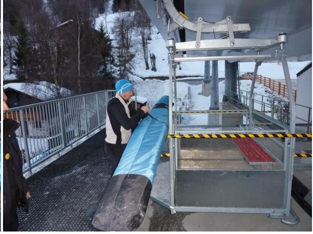
Pose des sangles