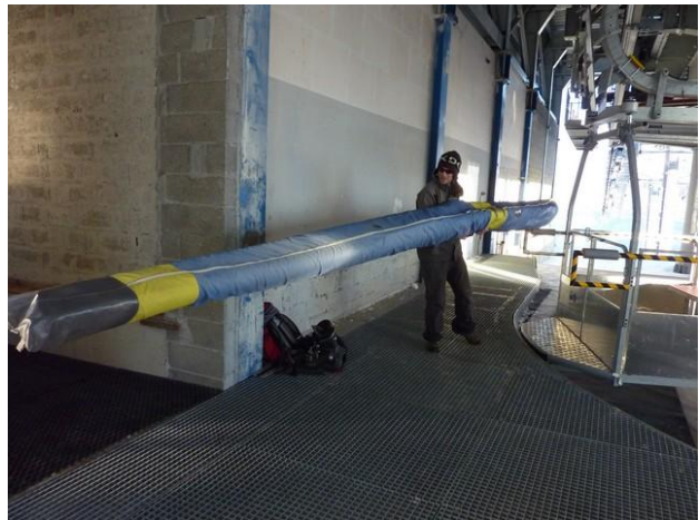
Déchargement aisé à l'arrivée